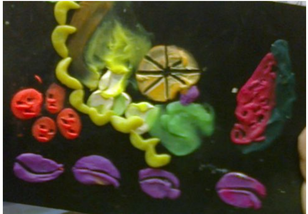
Фруктовый натюрморты, Тарас Г., 5 лет.