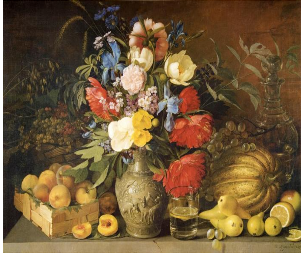
Хруцкий И. Т. «Цветы и плоды», 1839.