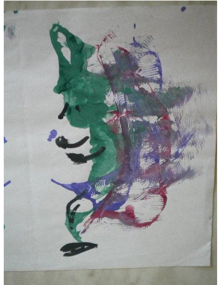
«Эльф», Тимур З., 5,5 лет.