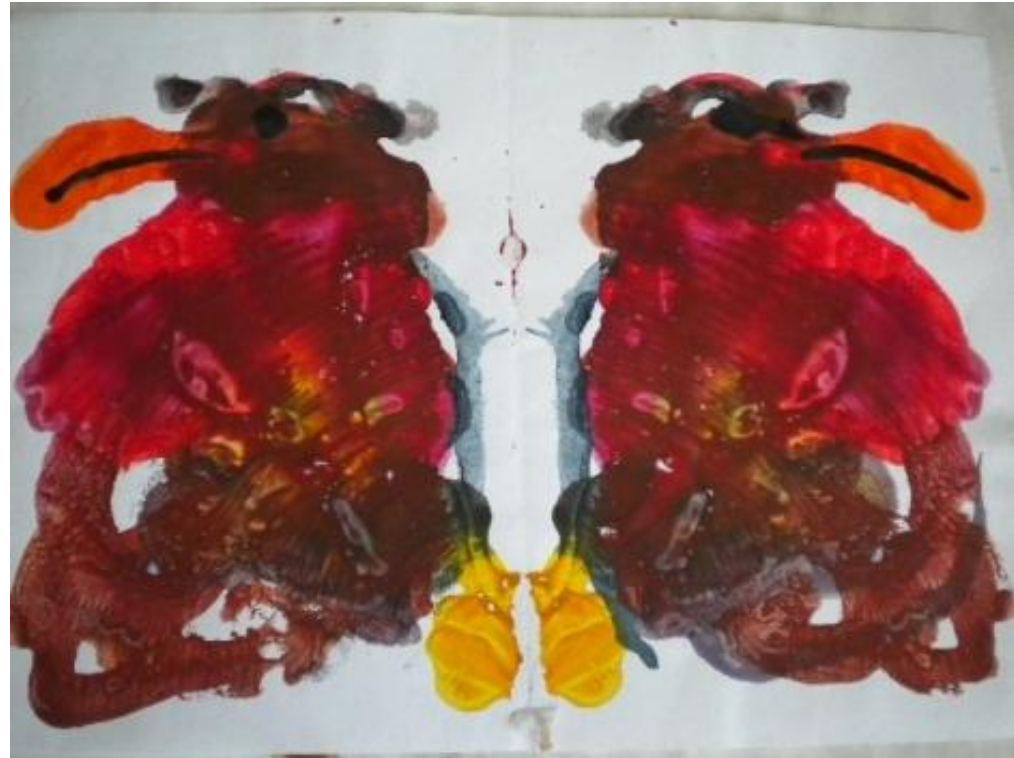
Сказочная птичка, Лиза Б., 5 лет.