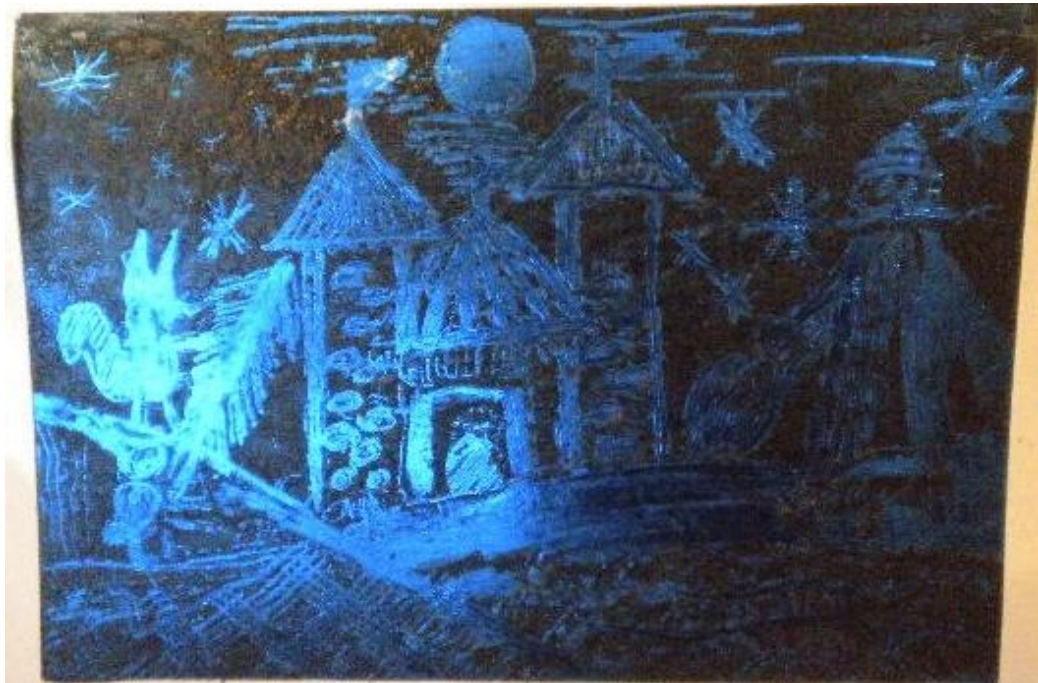
Зимняя фантазия, Юра Х., 6 лет.