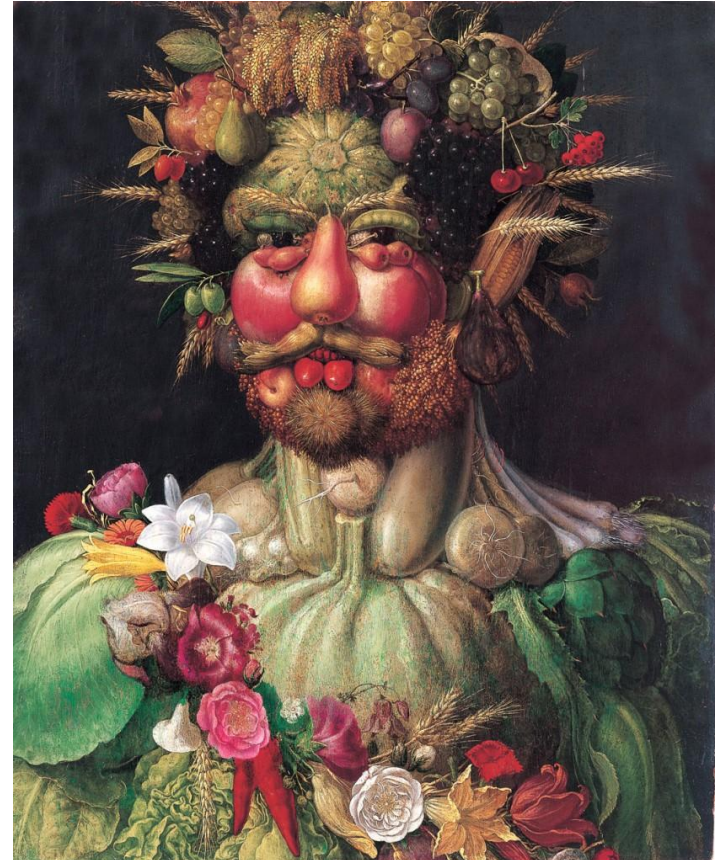
Джузеппе Арчимбольдо, «Портрет императора Рудольфа II в образе Вертумна», XVI в.