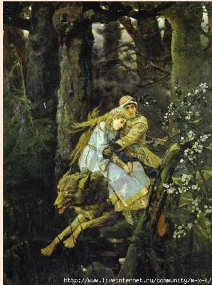
«Иван-царевич на сером волке». 1889

Г) (В)верху деревья переплелись ветвями, сквозь которые (редко) редко пробивается солнечный луч.