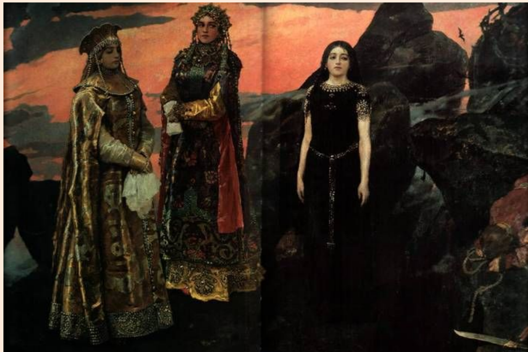
«Три царевны Подземного Царства». 1884

В) (Из)редка выходят красавицы на волю из