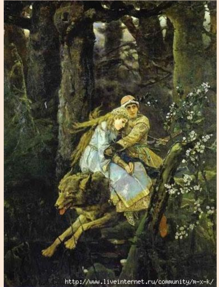
«Иван-царевич на сером волке». 1889

Г) (В)верху деревья переплелись ветвями, сквозь которые (редко) редко пробивается солнечный луч.