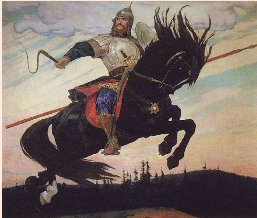
Богатырский галоп, 1914

Г) Зорко высматривает богатырь с копьём (на)изготовку врагов родной земли.