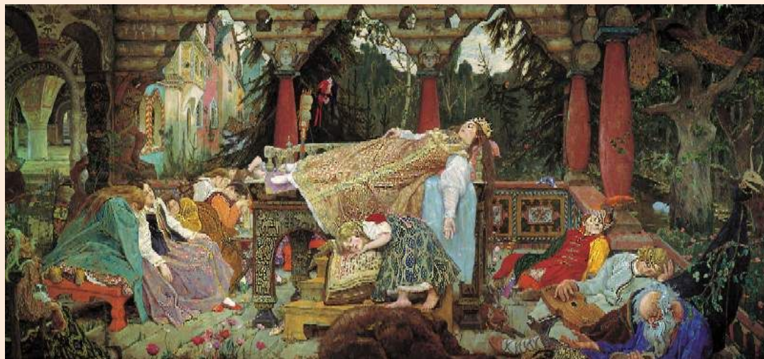
Спящая царевна, 1926