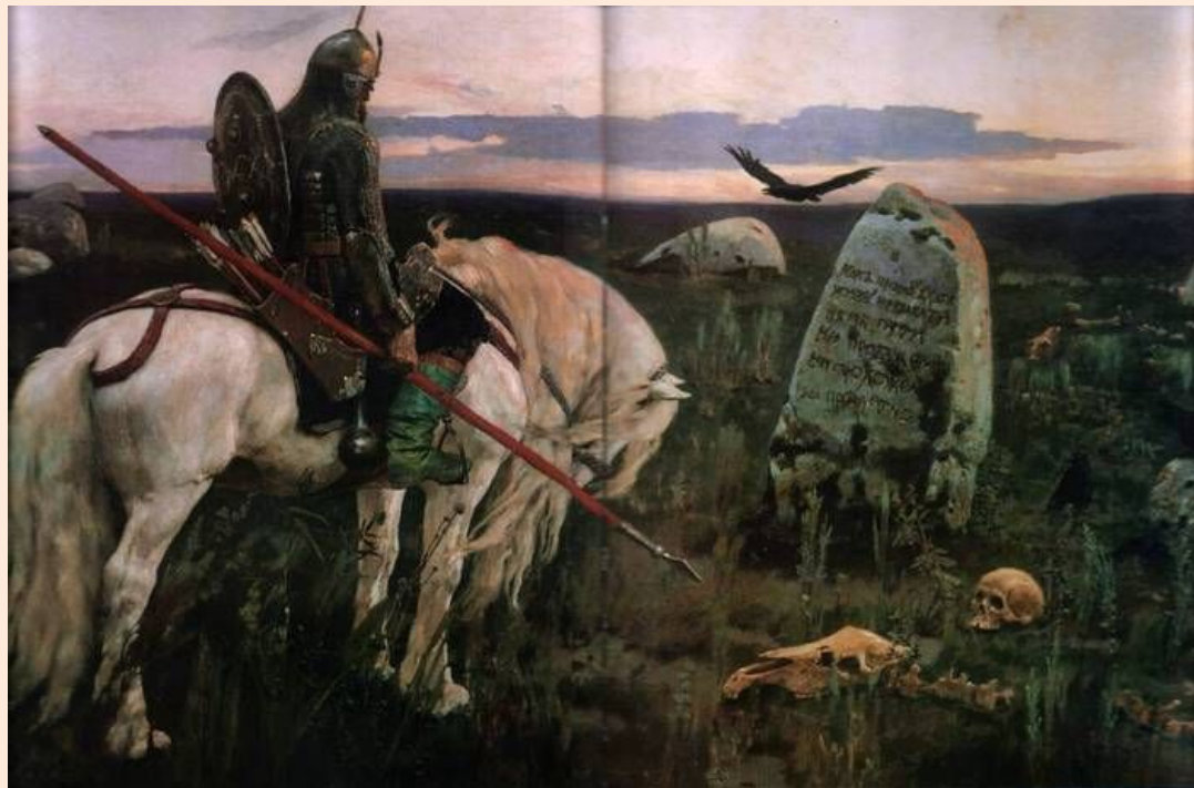
«Витязь на распутье». 1882