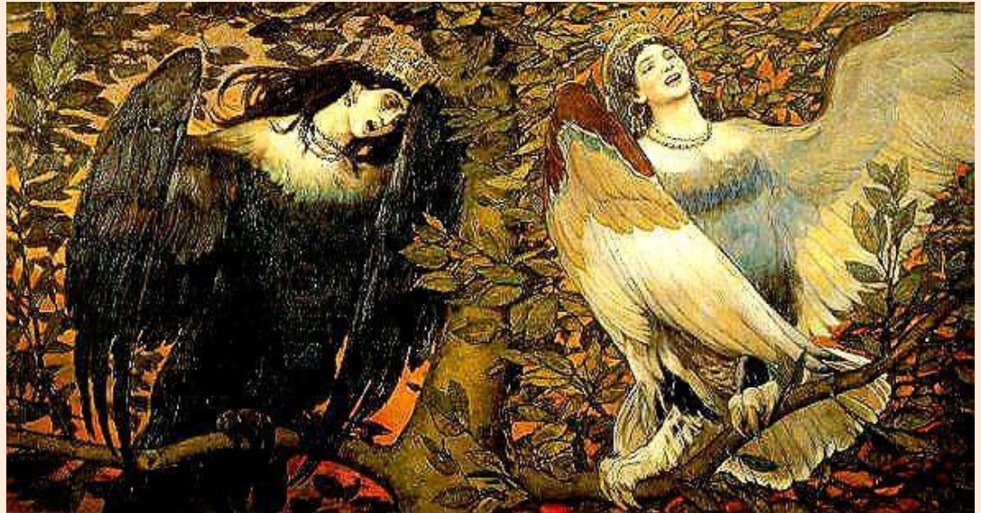
Песнь радости и печали, 1898

Многие наречные выражения требуют обращения к словарю и запоминания!