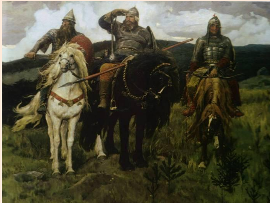
«Богатыри» (Три богатыря). 1898

В) (Много) много раз (бок) (о) (бок) богатыри отражали набеги кочевников.