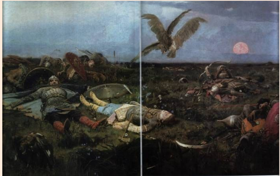
«После побоища Игоря Святославича с половцами». 1880