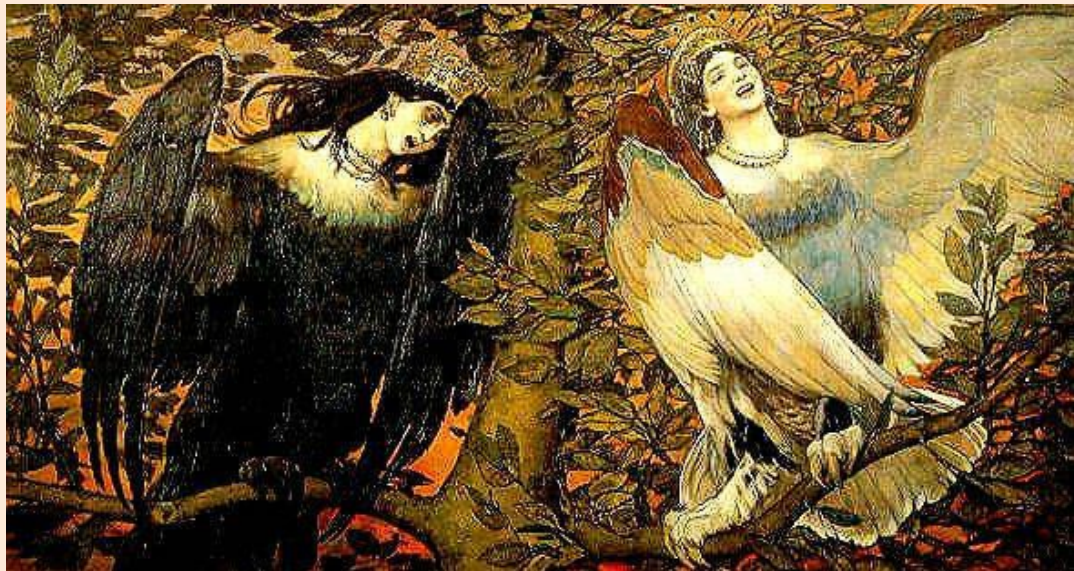
Песнь радости и печали, 1898

Многие наречные выражения требуют обращения к словарю и запоминания!