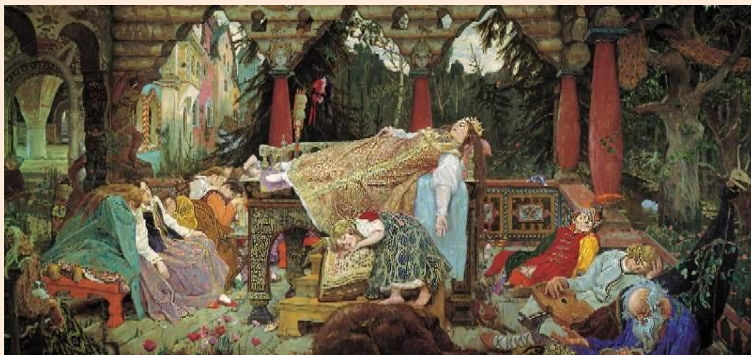
Спящая царевна, 1926