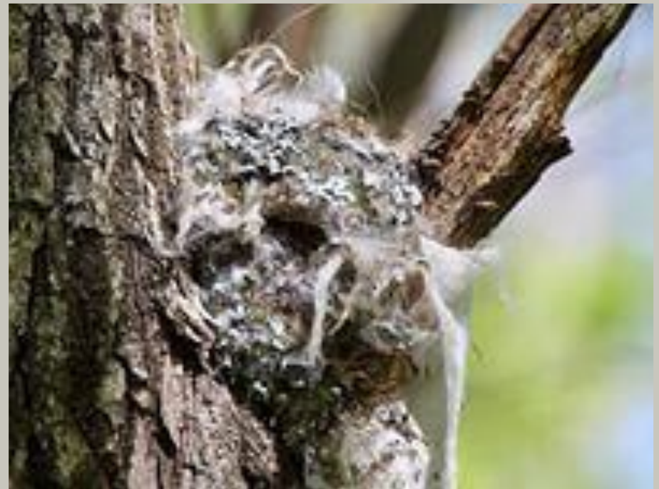
Гнездо синицы долгохвостой