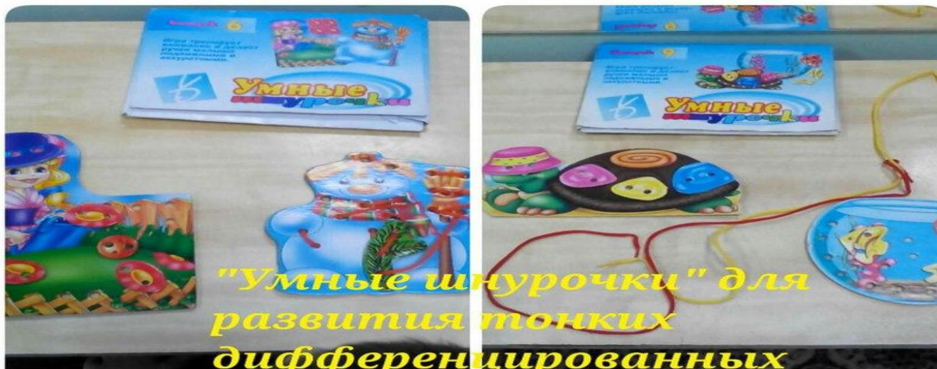
"Умные шнурочки" для развития тонких дифференцированных движений пальцев рук