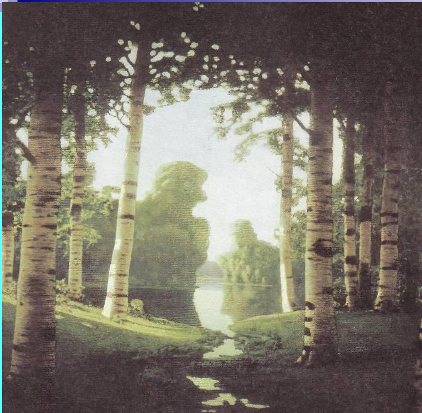
А.Куинджи «Березовая роща».