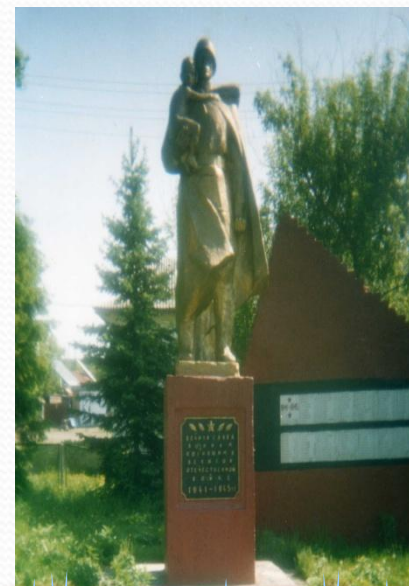
ПАМЯТНИК ПАВШИМ ЗА РОДИНУ