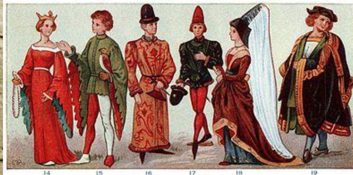
DRESS OF ANCIENT PERIOD (SEE DESCRIPTION FOLLOWING)