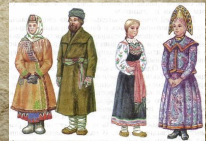
Одежда русских крестьян