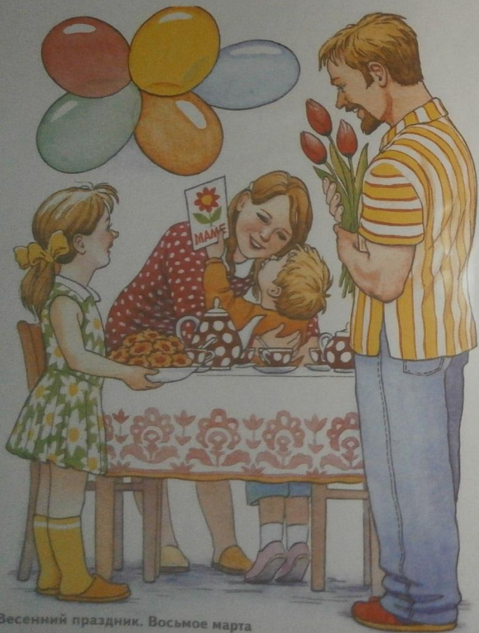
Весенний праздник. Восьмое марта