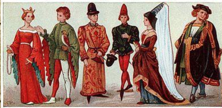
DRESS OF ANCIENT PERIOD (SEE DESCRIPTION FOLLOWING)