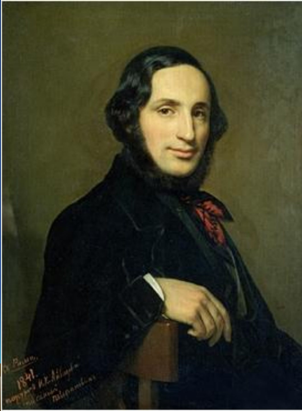
Художник-маринист И. К. Айвазовский