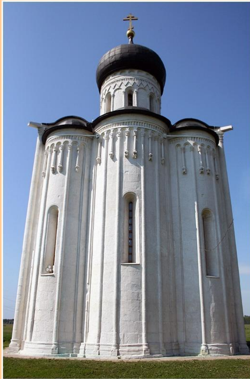
Храм Порова на Нерли (фото)