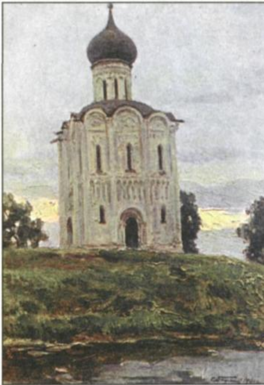
С.А.Баулин «Храм Покрова на Нерли»