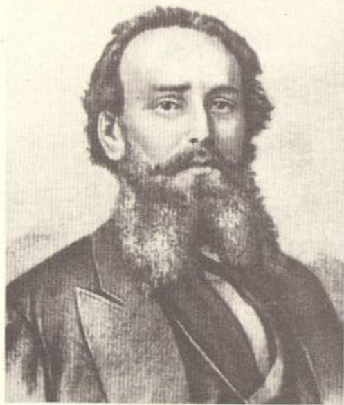
А. М. Опекушин 1841 - 1923