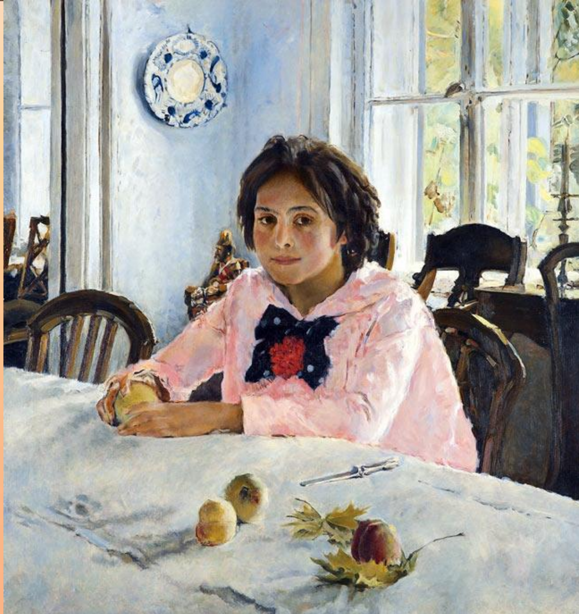
В.А. Серов. Девочка с персиками (портрет дочери С.И. Мамонтова - Веры). 1887 г.