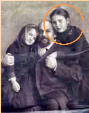
Вера Саввишна Мамонтова (1875-1907) — первая дочь Саввы Иваноча и Елизаветы Григорьевны Мамонтовых

Он (Серов) был несказанно очарован при виде старшей дочери Мамонтовых, Веруши, которой давно уже не видел. Она так расцвела и похорошела, что он едва узнал ее. Черноглазая, с румянцем во всю щеку, с копной густых каштановых волос на голове, она казалась старше своих лет, почти барышней, хотя ей не было еще полных двенадцати лет. Серов сразу решил ее писать — в том самом платье, в котором увидал, — в розовой кофточке, с черным бантом... Сядься в абрамцевской столовой против своей модели, Серов не был уверен, удастся ли ему выразить в своей картине то, что задумал. Ибо задумал он не просто портрет, а портрет-картину. Как ни восхищала его стоявшая перед ним чисто цветовая задача, но еще больше волновала его сама модель, ясные, детски чистые глаза чудесной русской девушки и весь ее обаятельный образ.