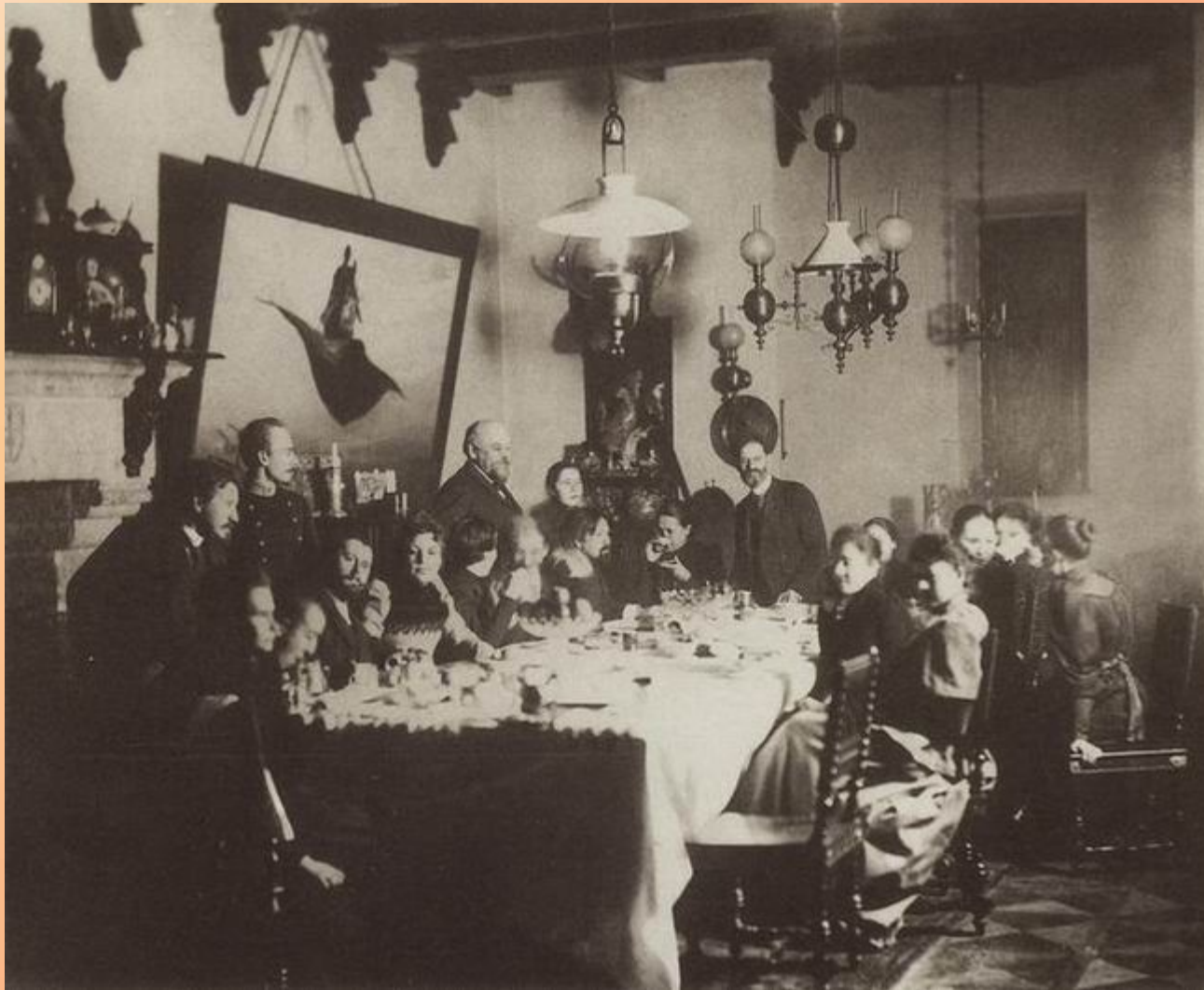
У Саввы Ивановича Мамонтова. 1889. На фотографии присутствуют – Серов, Коровин, Мамонтов