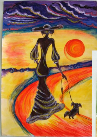
Баруздина Юлия 15 лет г. Бакунга иллюстрация к рассказу «Дама с собачкой»