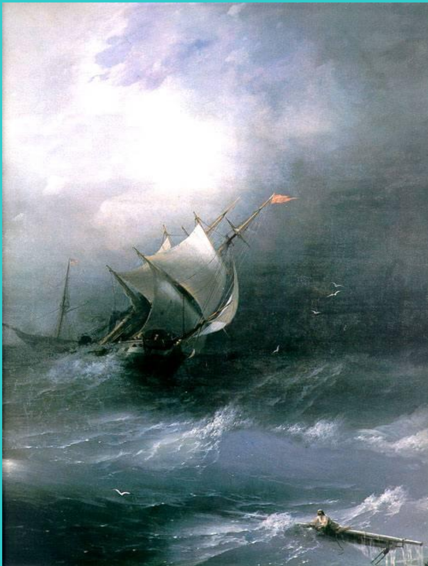
И.К.Айвазовский «Буря на Ледовитом океане»