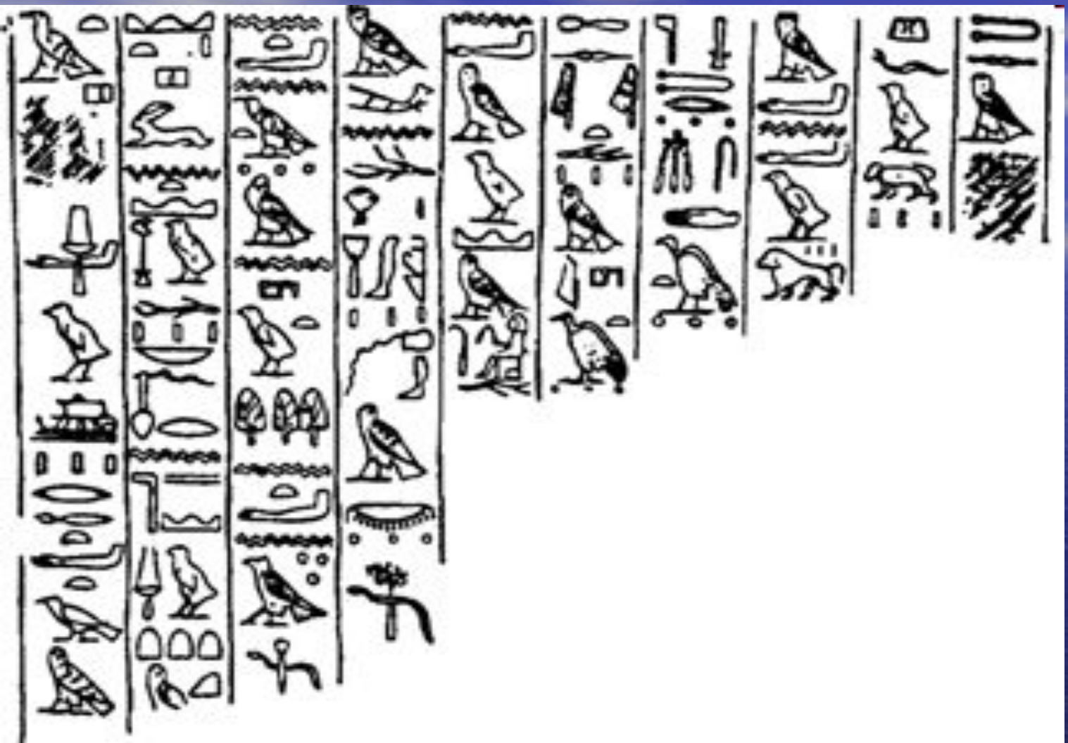
Иероглифы. Древнеегипетское письмо.