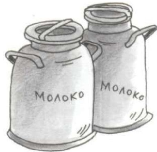
Фляги с молоком