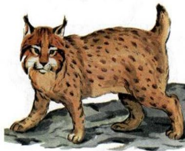
В ЛЕСУ РЫСЬ.