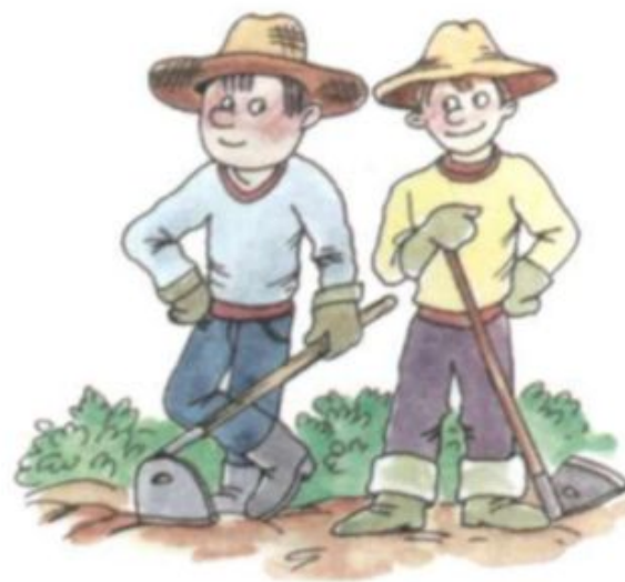
У огородников тяпки