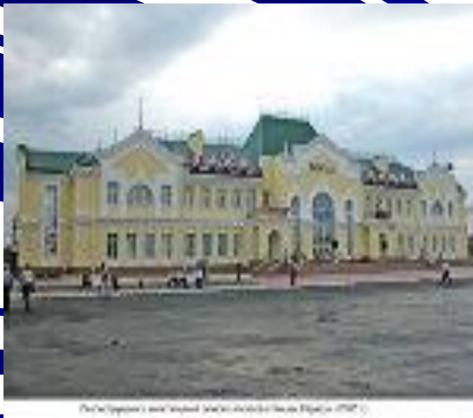
Рейсовый вокзал в Лондоне (1862 г.)