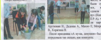
Конкурс «Девочки короны»

Актив отряда юных инспекторов движения школы №74 г. Самара