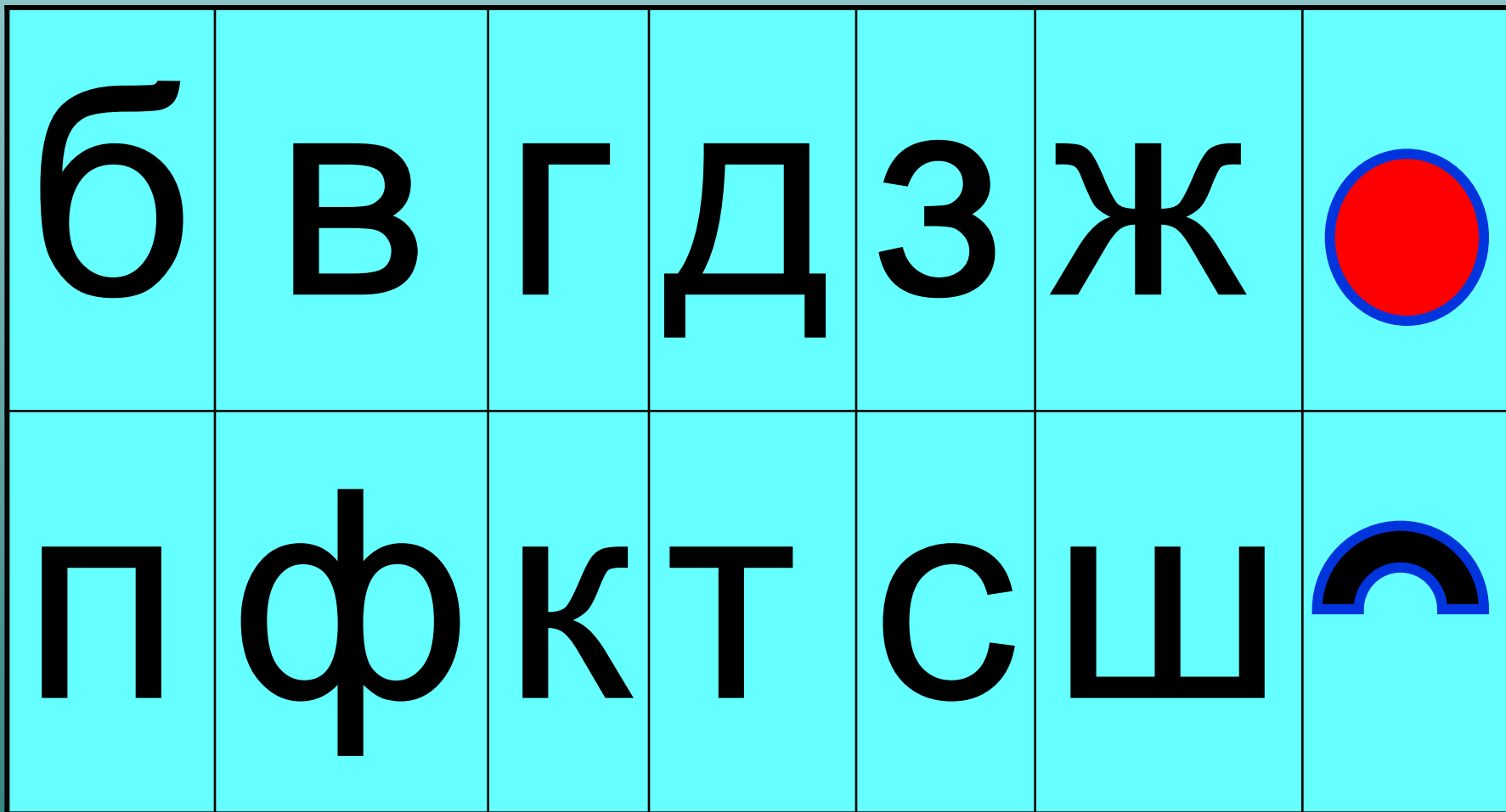
Схема проверки парного согласного в слабой позиции