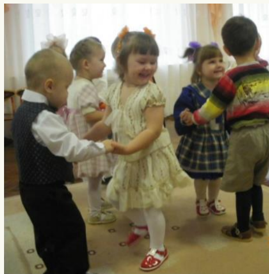
Развлечение «Давай дружить»