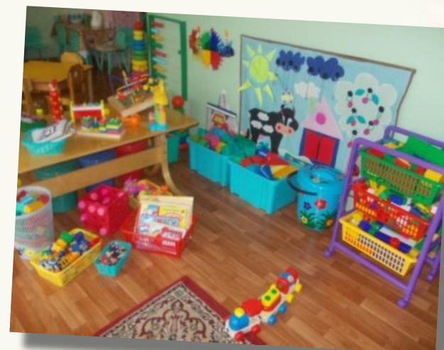
Центр сенсорного развития