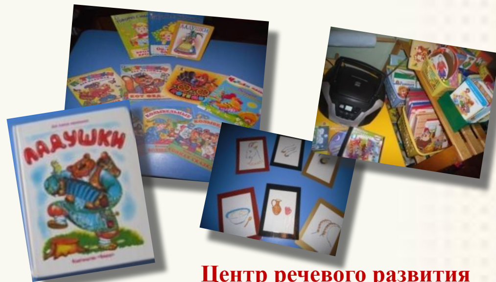
Центр речевого развития