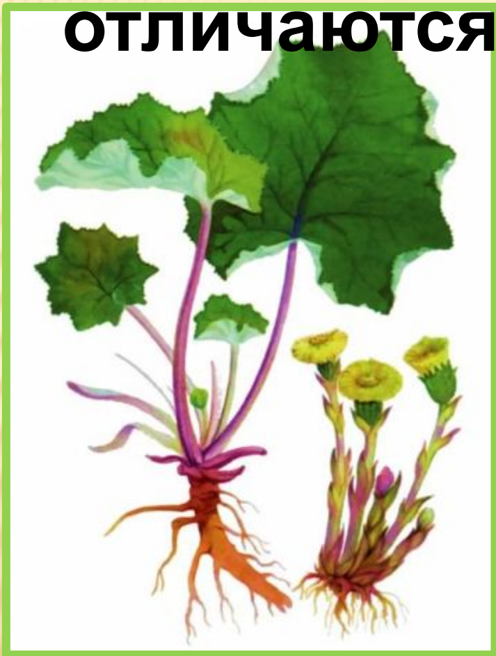
Мать – и – мачеха