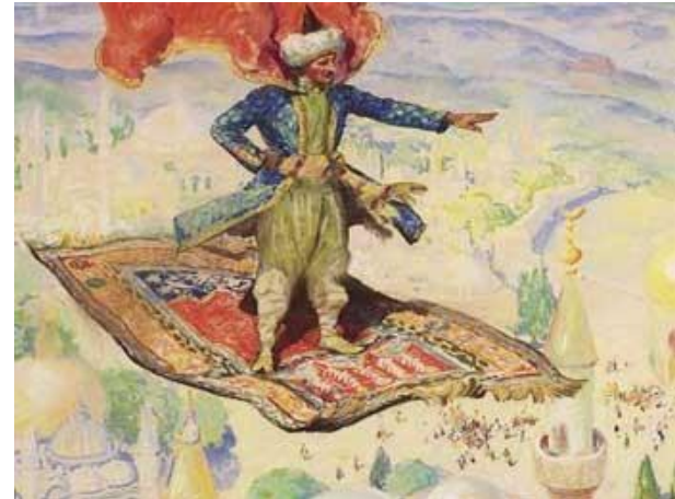
Ковер – самолет