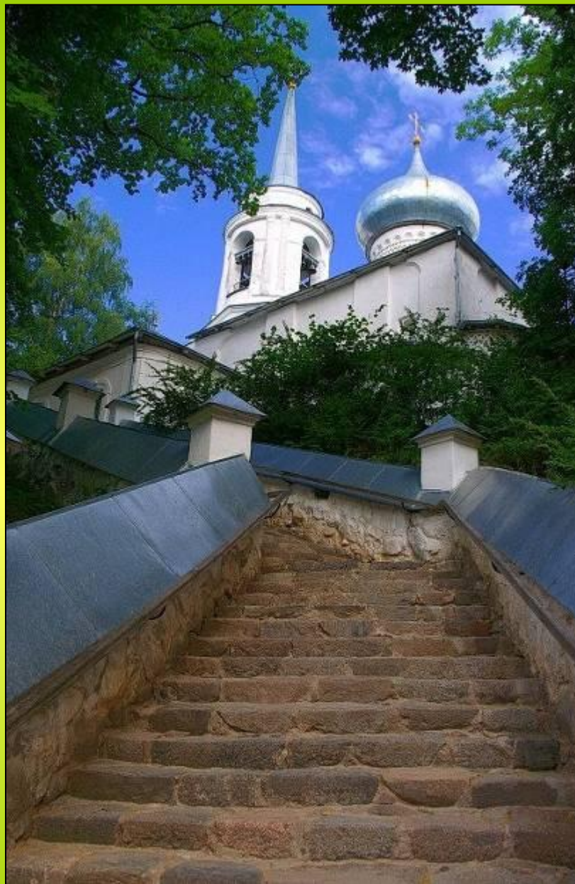
Святогорский Свято-Успенский монастырь 12