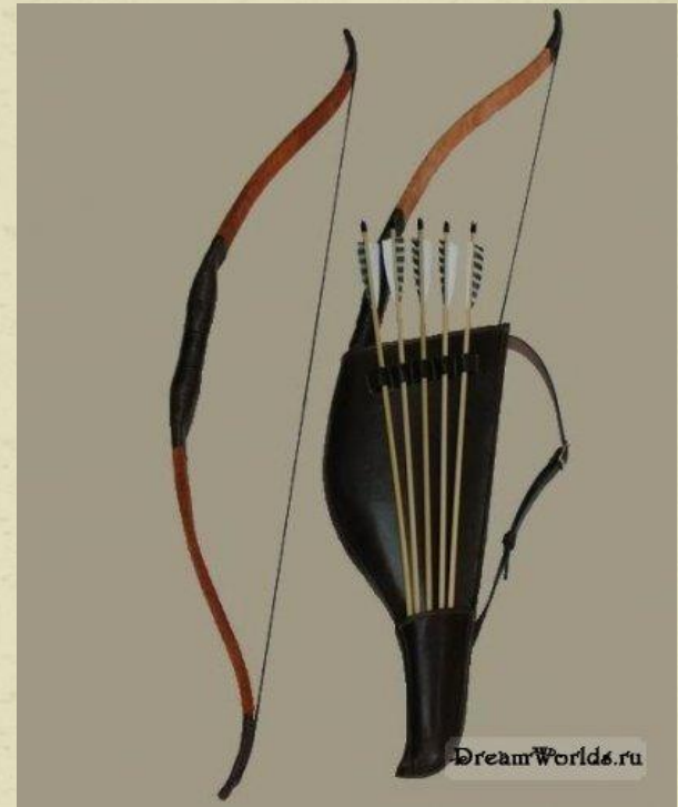
Лук. Колчан со стрелами