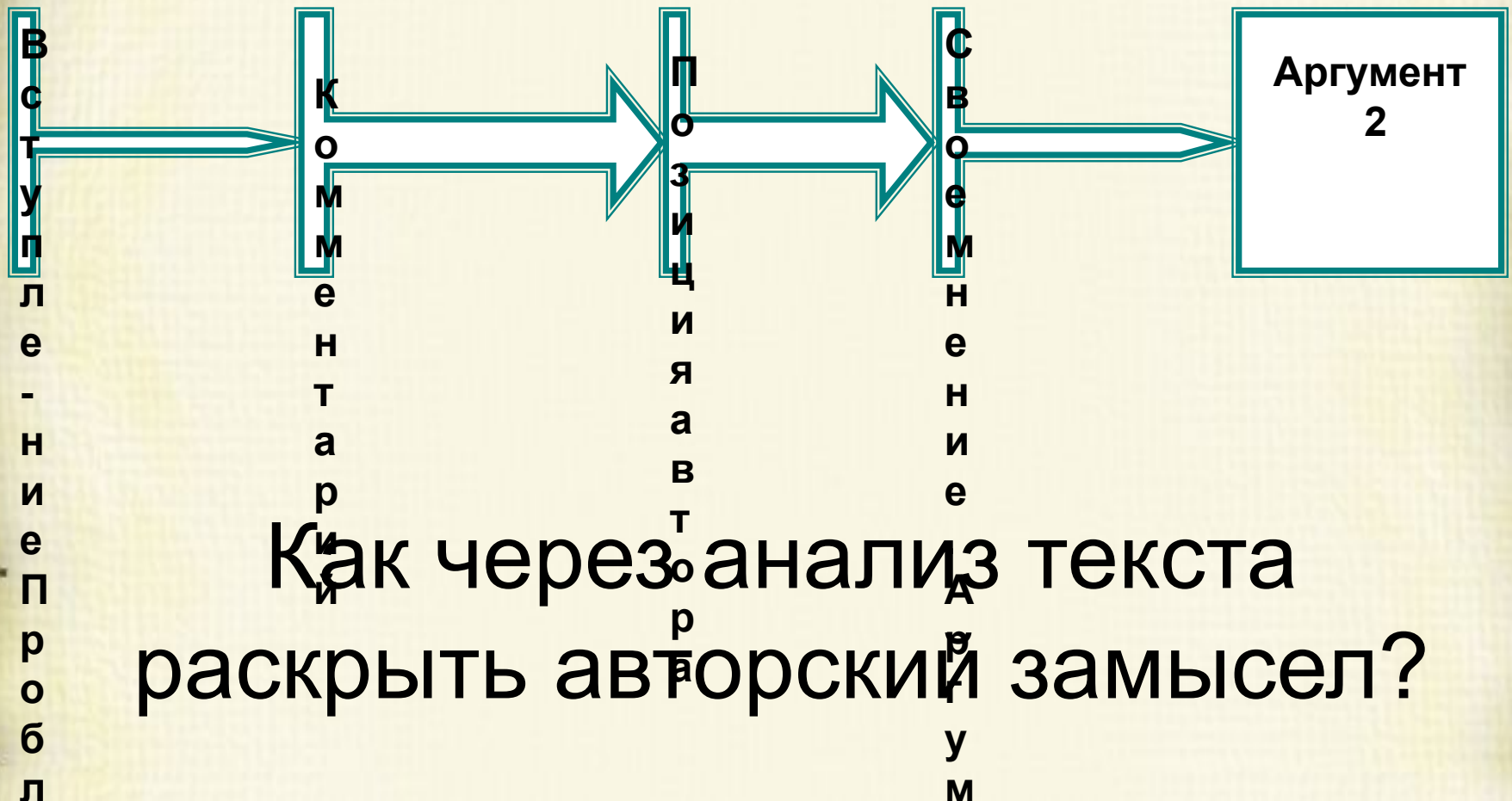
Схема сочинения-рассуждения (часть С)