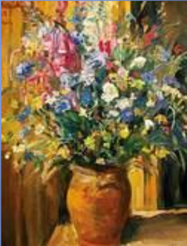
Н. Миллиоти. Полевые цветы

На лугу растёт ромашка, Лютик едкий, клевер, кашка! Что ещё? Кошачьи лапки, Одуванчиковы тапки, Подорожник, васильки, Граммфончики – вьюнки, Ещё много разных травок У тропинок, у канавок, И красивых, и пушистых, Разноцветных и душистых!