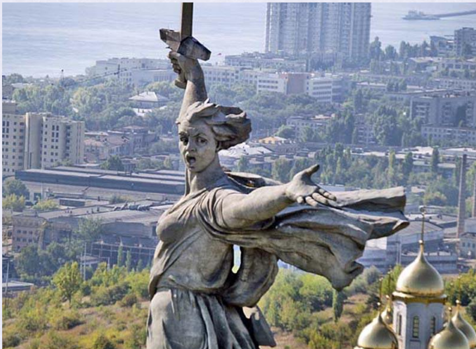
Вид с высоты полета