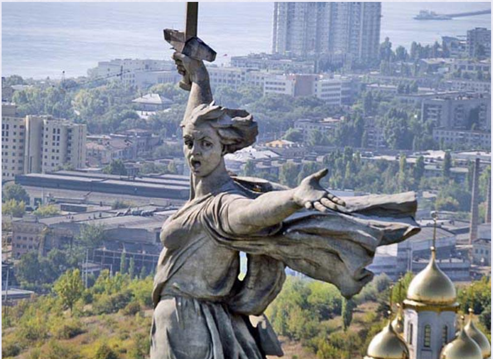
Вид с высоты полета