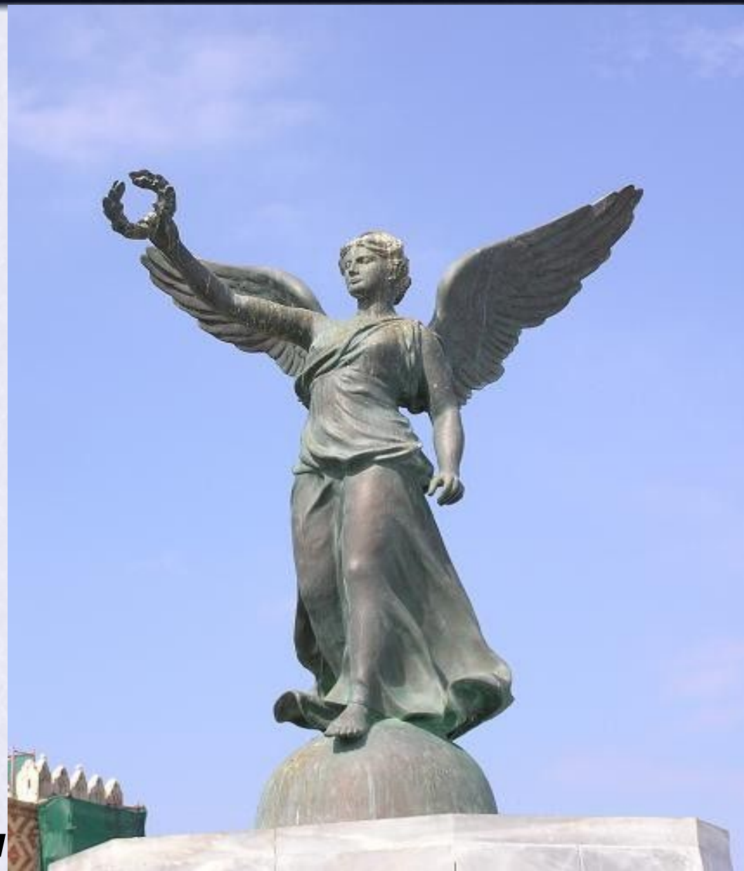
Ника- богиня победы