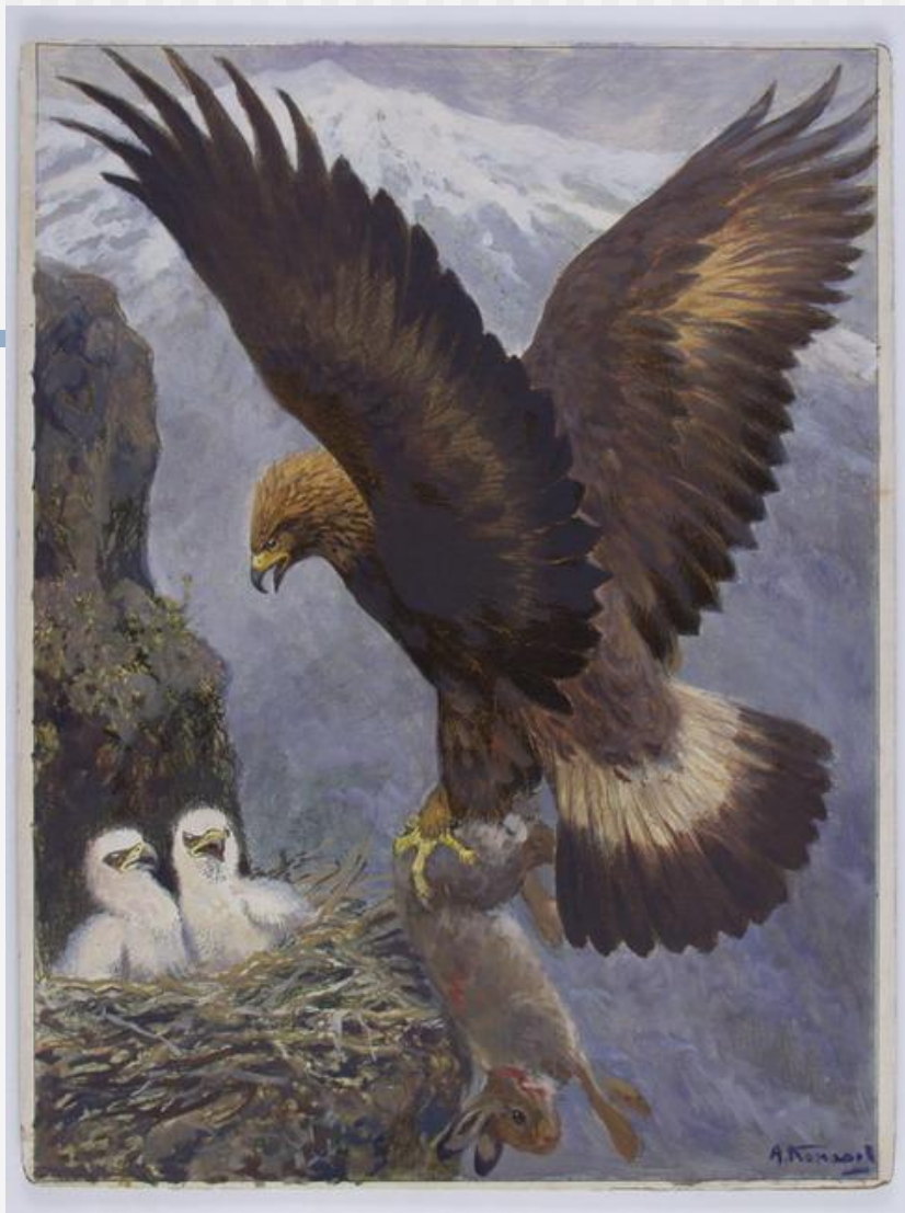
«Орел с добычей»