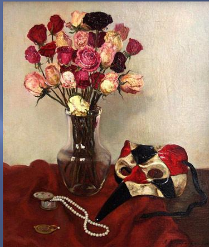
А. Ласкаржевская. Натюрморт с маской

Букет из красных гвоздик – Меня томит любовь к тебе.