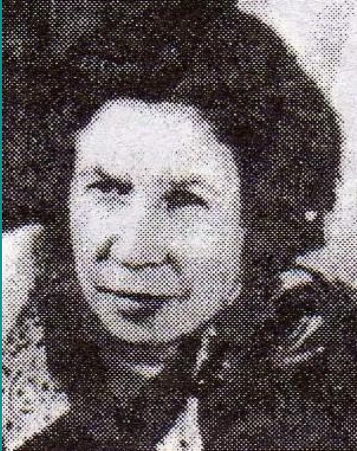
В. А. Осеева – Хмелёва (1902 - 1969 гг)