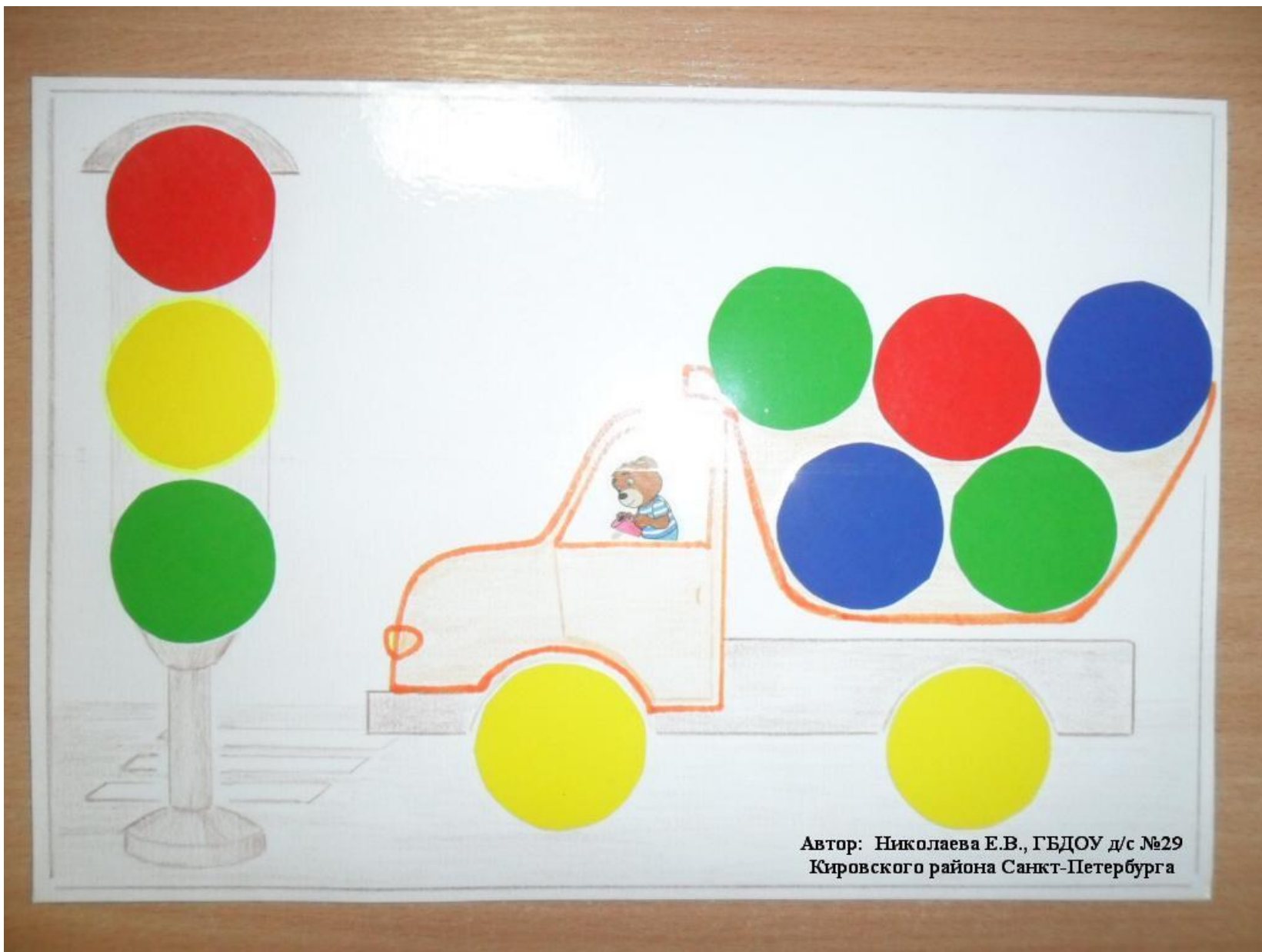
Автор: Николаева Е.В., ГБДОУ д/с №29 Кировского района Санкт-Петербурга