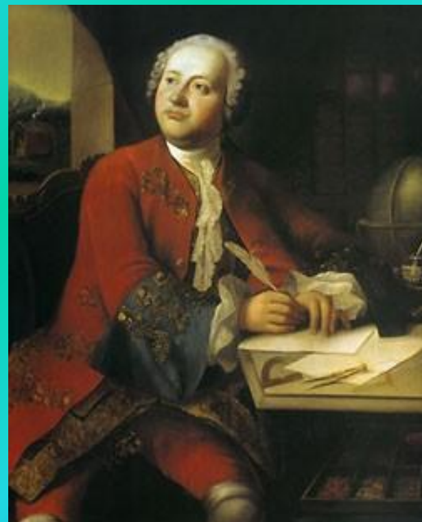
Вортман, Христиан-Альберт. Портрет М.В. Ломоносова. Не позднее 1784 г. ГИМ

считал, что эти буквы «прячут» два звука: [й'] и последующий гласный. Он назвал их «потаёнными».