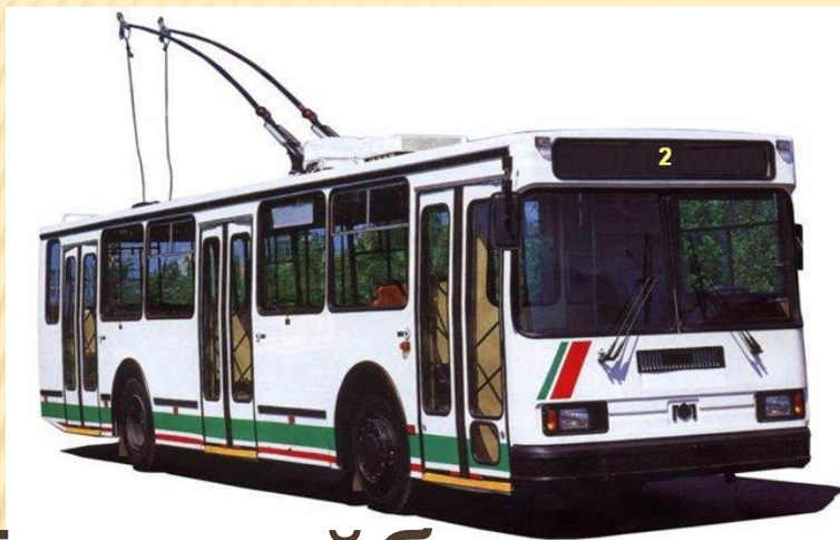
Тролл е йбус