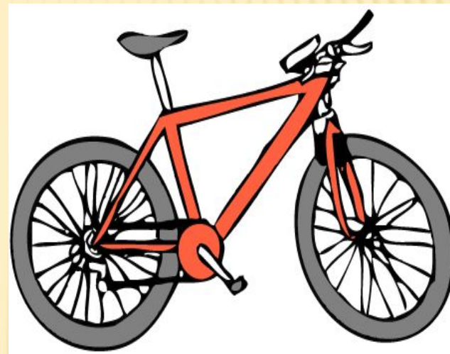
Велоси л ед