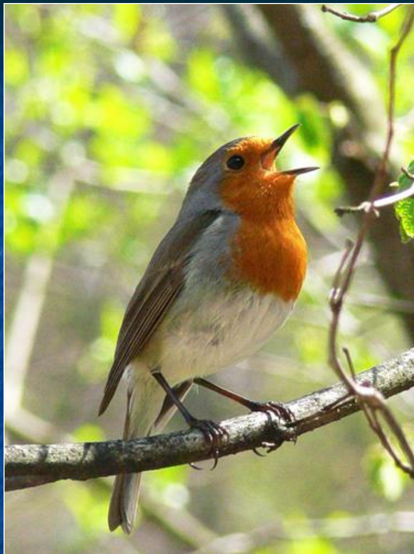
ЗАРЯНКА ( малиновка )