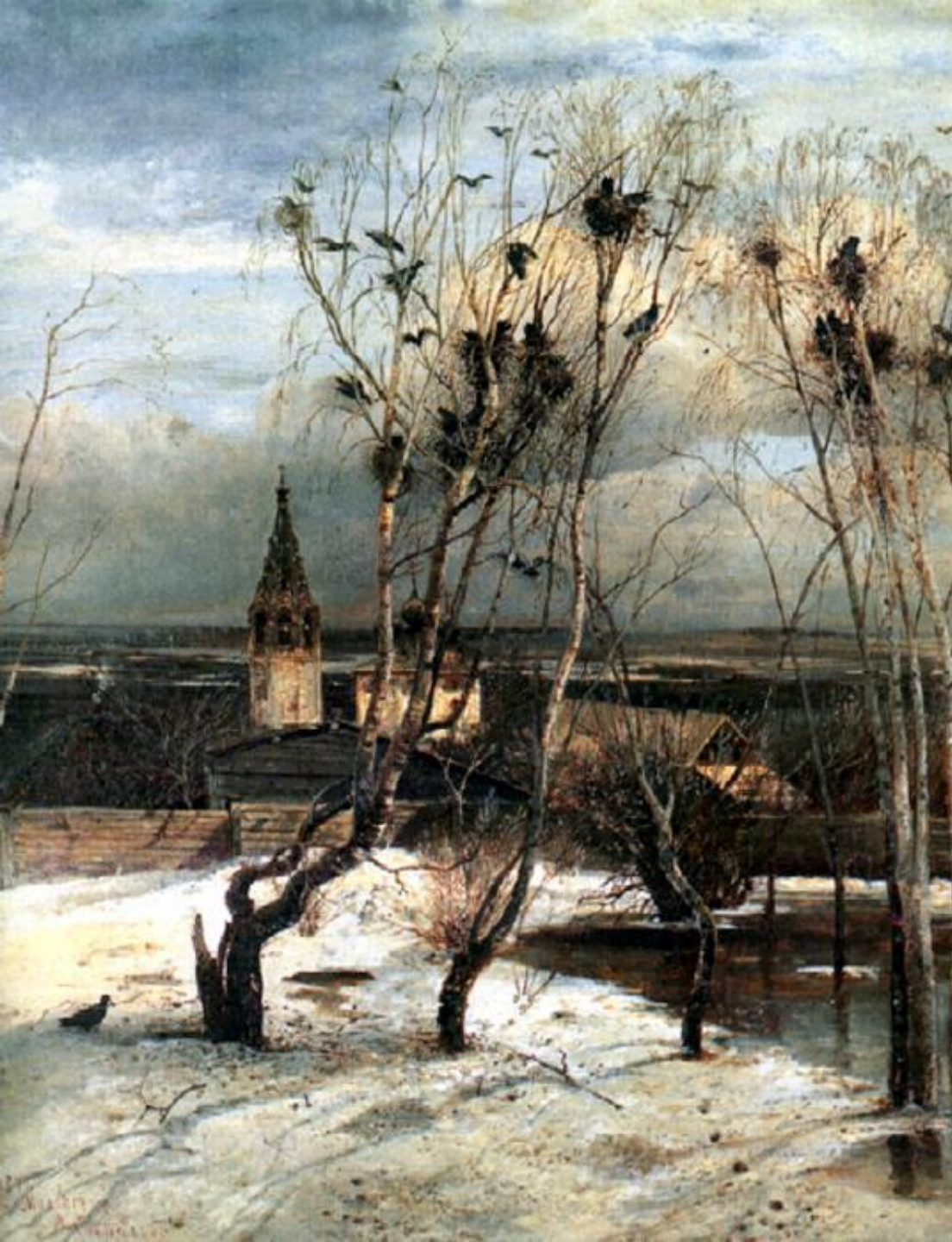
А.К.Саврасов Грачи прилетели