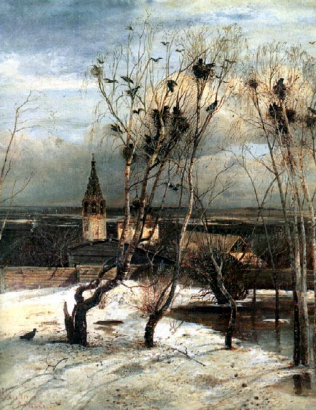
А.К.Саврасов Грачи прилетели