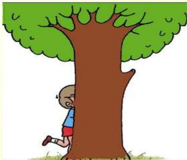
Мальчик спрятался за дерево