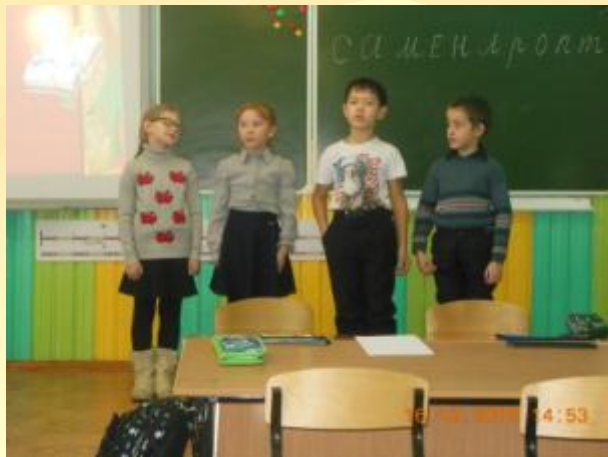
Команда 3 класса «Русские моряки»