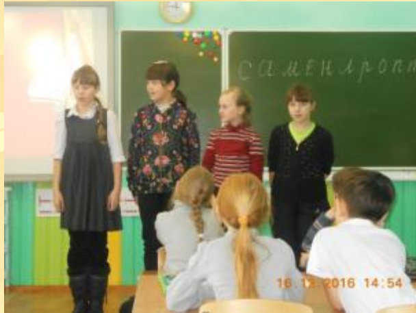
Команда 4 класса «Девчата»