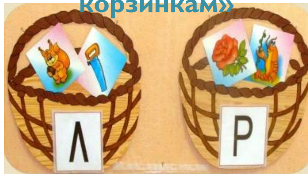
«Картинки по корзинкам»