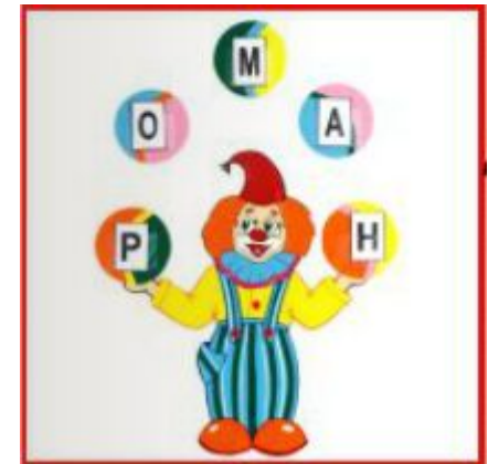
«Клоун» чтение слова