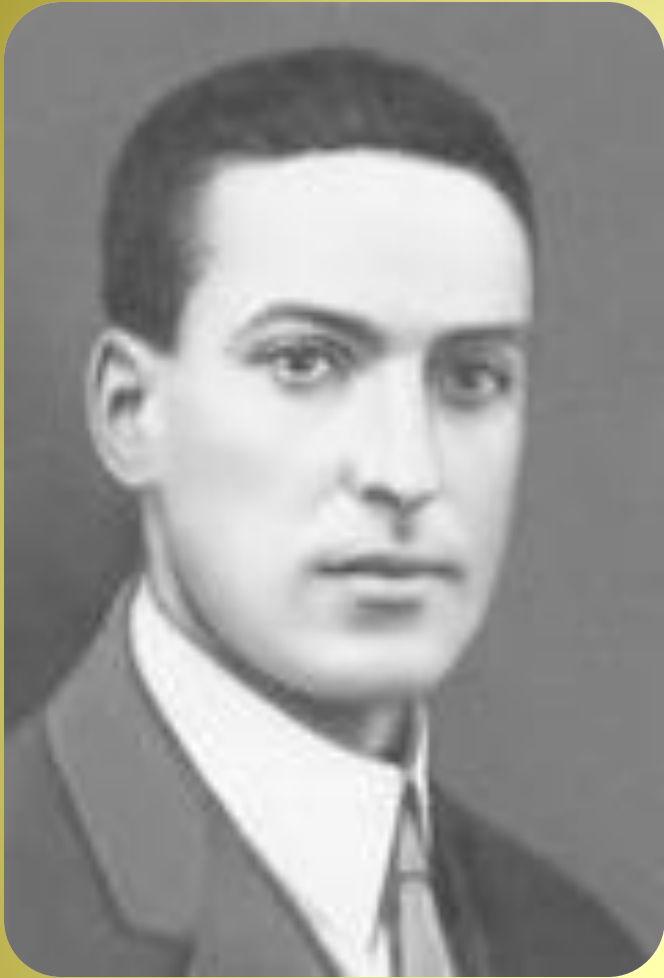
Выготский Л. С.

Всесторонняя подготовка детей к школе – главная задача детского сада. По словам Л. С. Выготского «только то обучение в детском возрасте хорошо, которое забегаёт вперёд развития и ведёт развитие за собой» Раннее развитие – это тот фундамент, когда закладывается прочное здание. Наша задача состоит в том, чтобы прививать пожизненную любовь к познанию. Учить читать следует до школы, чтобы потом у первоклашек не возникло много проблем, одна из которых комплекс неполноценности.