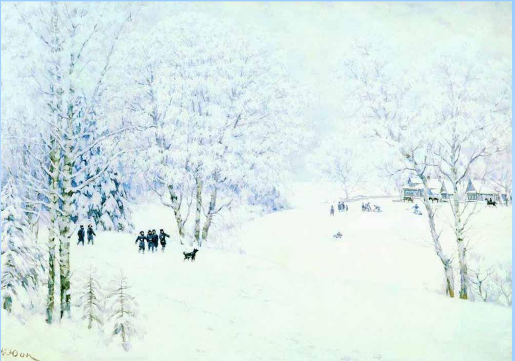
«Русская зима. Лигачево» , 1947 Холст, масло. 132 x 185 см Государственная Третьяковская галерея