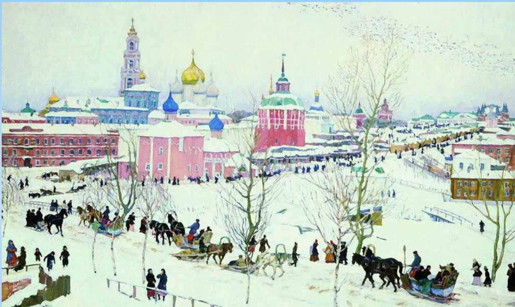
«Троицкая лавра зимой», 1910 Холст, масло. 125 x 198 см Государственный Русский музей