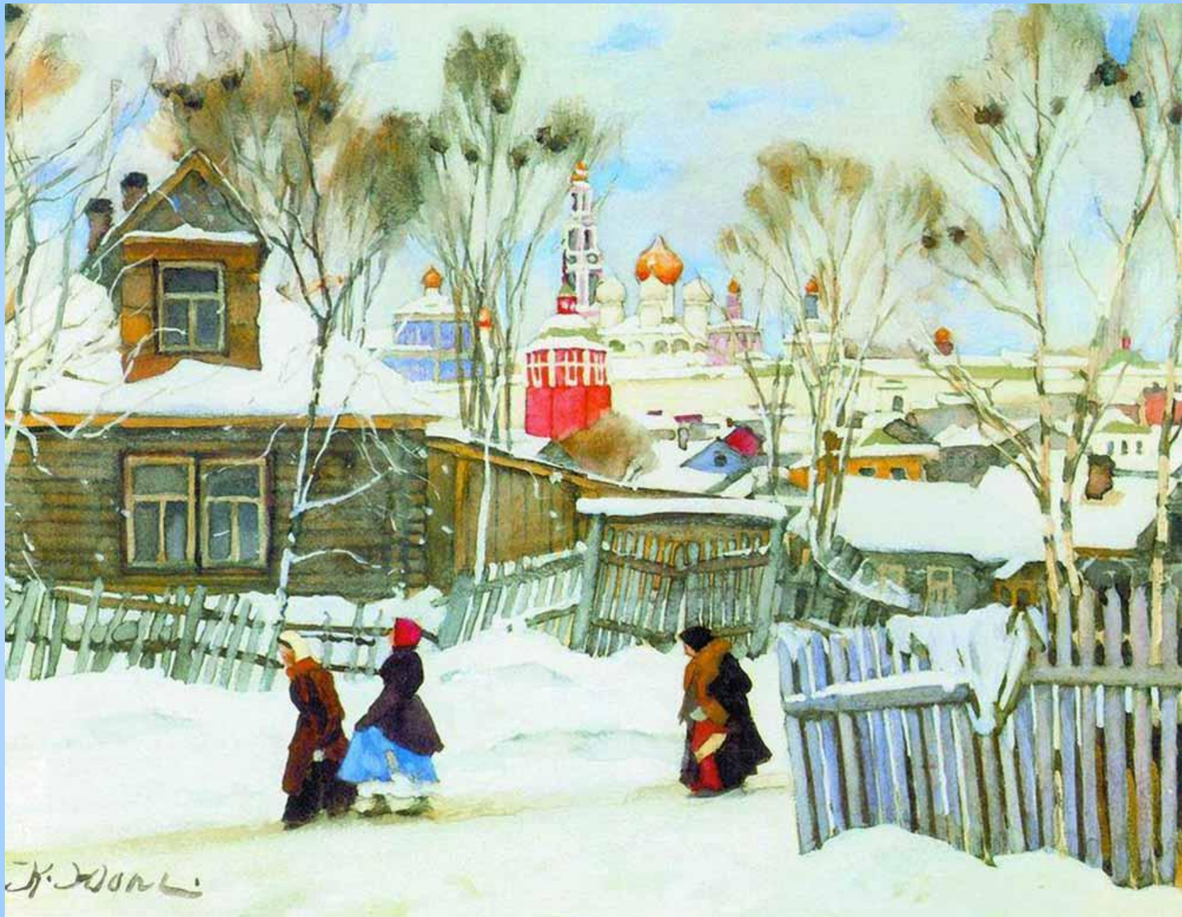
«Вид Троицкой лавры», 1916 Бумага, акварель, белила. 22.5 x 30 см Государственная Третьяковская галерея