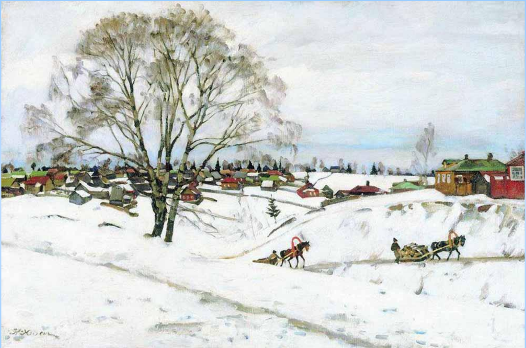
«Зима. Черные березы. Сергиев Посад», 1921 Холст, масло. 53.4 x 81 см Вологодская областная картинная галерея