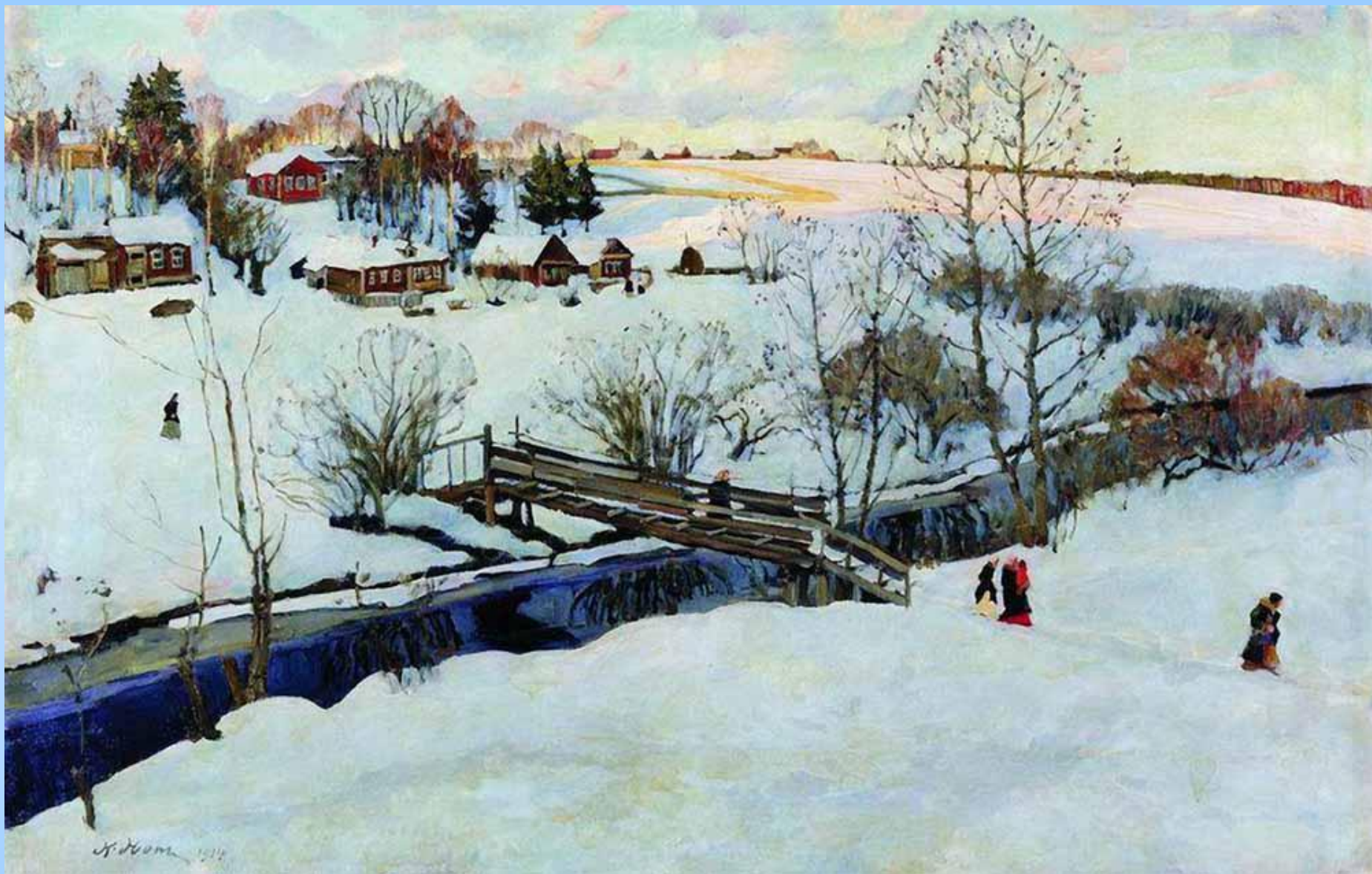
«Зима. Мостик» , 1914 Холст, масло. 68.6 x 104 см Пензенская областная картинная галерея им. К.А.Савицкого