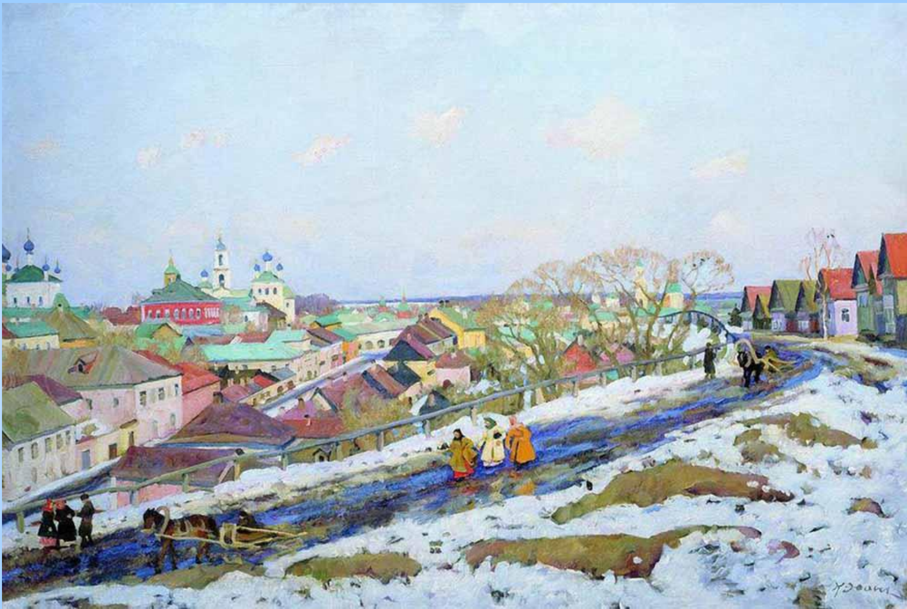
«В провинции. Город Торжок» Холст, масло. 75 x 111 см Калужский областной художественный музей