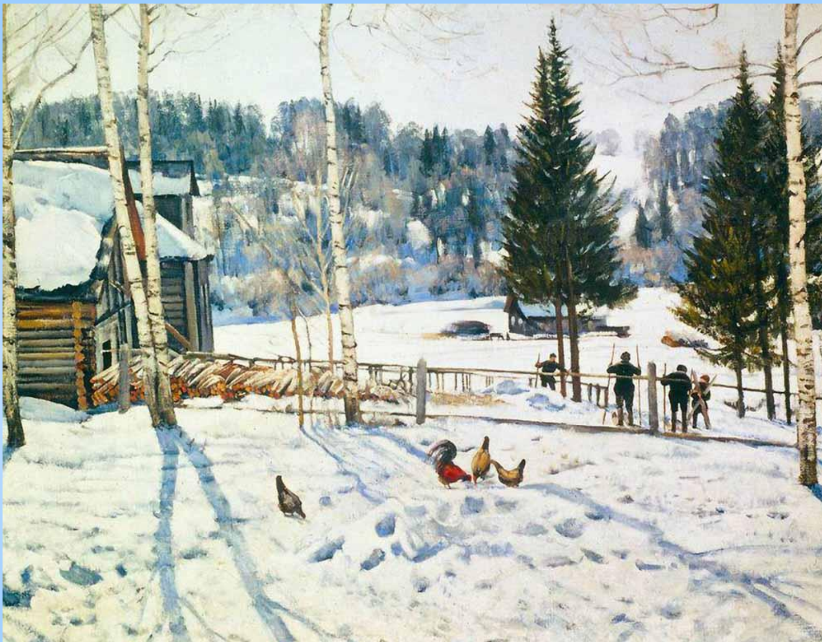
«Конец зимы. Полдень. Лигачево» , 1929 Холст, масло. 89 x 112 см Государственная Третьяковская галерея