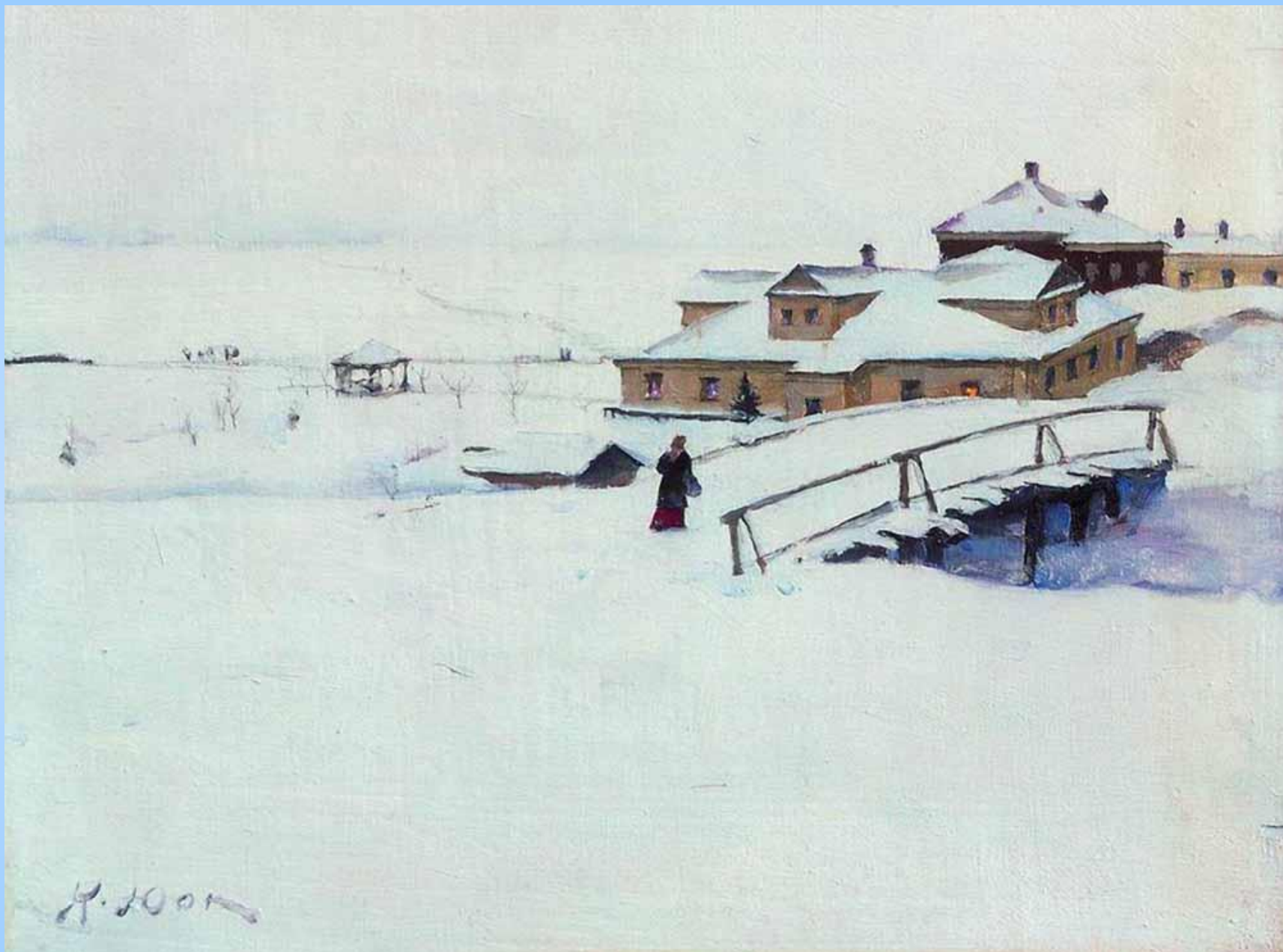
«Зимка», 1910 Фанера, масло. 23.2 x 30.2 см Частное собрание