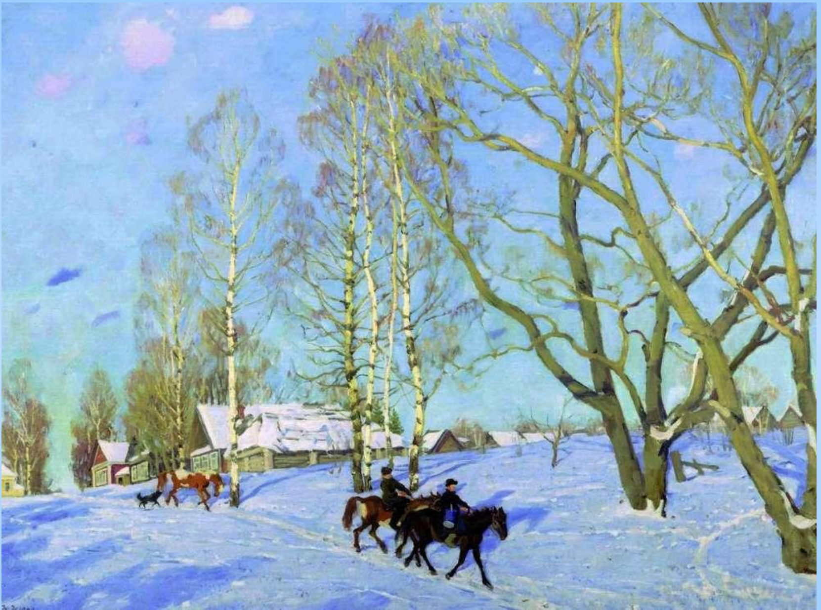
«Мартовское солнце» , 1915. Холст, масло. 107 x 142 см Государственная Третьяковская галерея