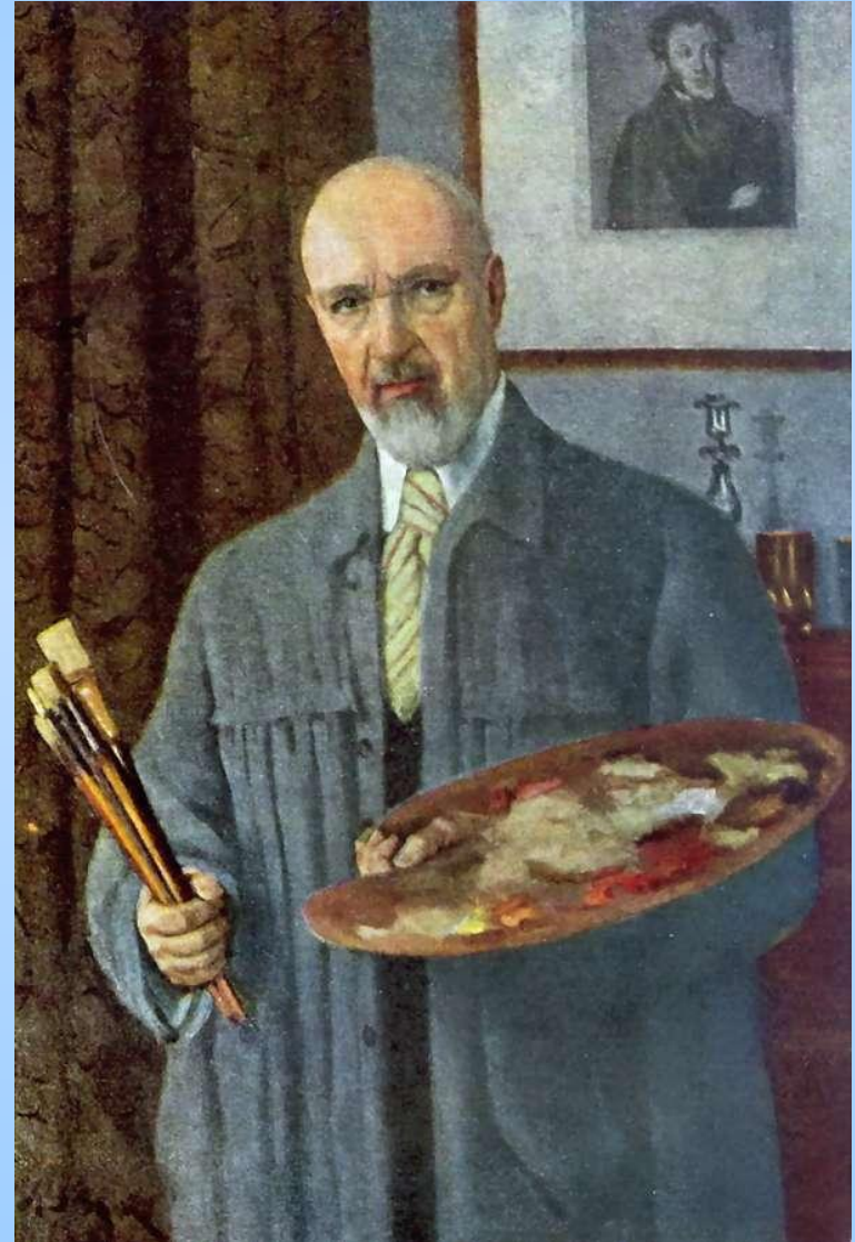
Автопортрет. 1953 г.

■ К. Ф. Юон умер 11 апреля 1958 года. Похоронен в Москве на Новодевичьем кладбище.