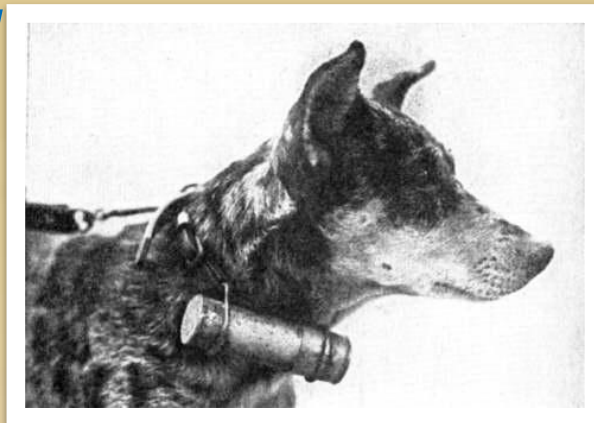
На ошейнике футляр для письма.

Собаки-связисты в сложной боевой обстановке, порой в непроходимых для человека местах доставляли боевые донесения. Для установления связи проложили тысячи км. телефонного провода. Иногда, даже будучи тяжело раненой, собака доползала до места назначения и выполняла свою боевую задачу.