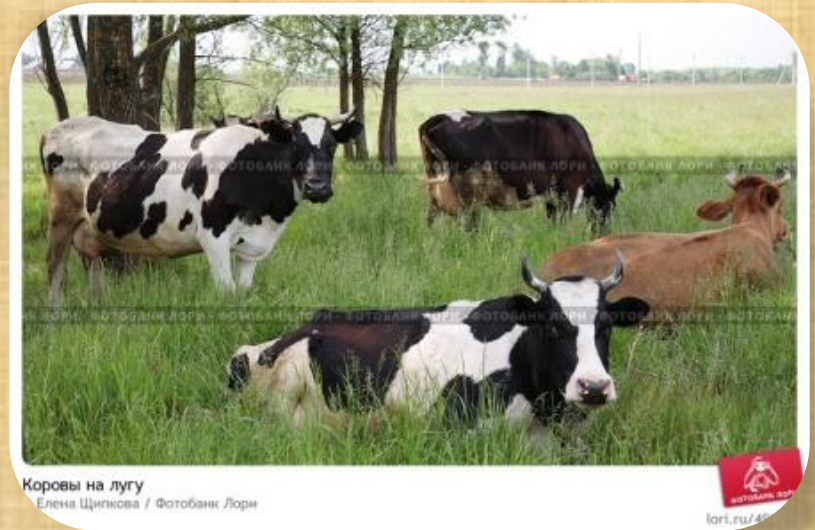
Коровы на лугу