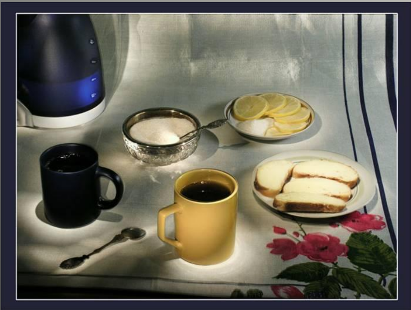
Завтрак – древнерусское заутрокъ.