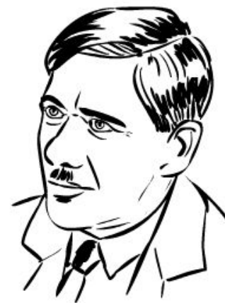
Корней Иванович Чуковский