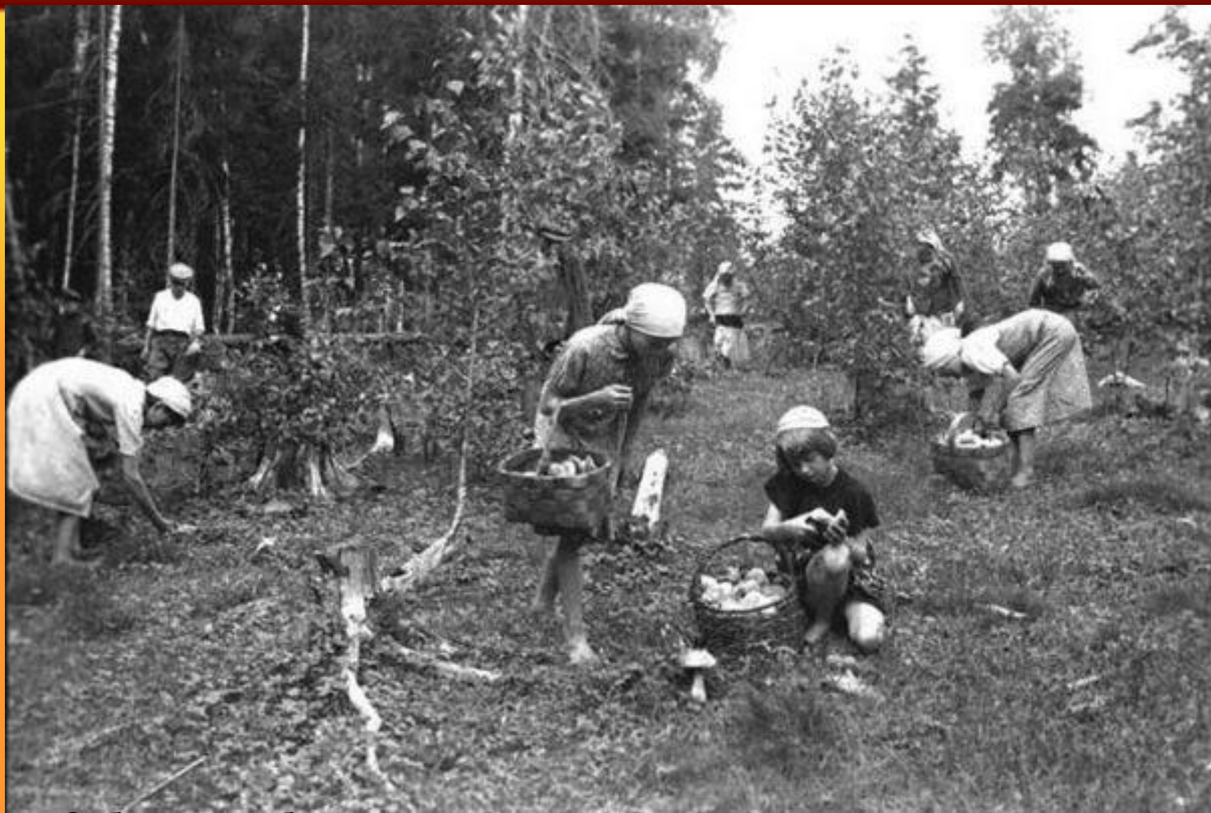
Собирали грибы и ягоды.