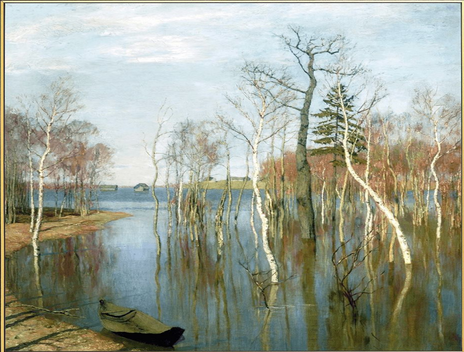
Левитан И.И. «Весна. Большая вода»